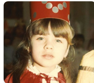
Egykor az Attila utcai óvodai farsangon

A játék tetszett, az óvodások kis tudósokként lelkesen válaszoltak a kérdéseimre. A gyerekekben nem szoktunk csalódní: mindig bölcsék, és sokat segítenek a nyelvész kutatóknak. Most sem volt ez másként: a válaszok nagyon okosak voltak és látszott, hogy a hajdúnánási gyerekek még rengeteg izgalmas dolgot fognak nekem mesélni a két helyben használt nyelvváltozatról, ha tovább kérdezem őket. Világos