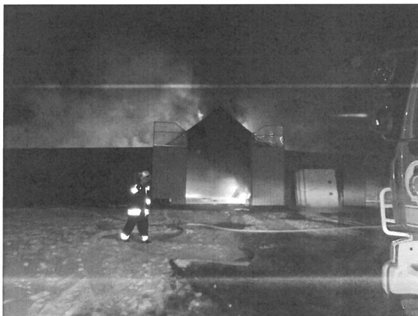
Hajdúböszörmény-Bodaszőlő, Zelemér utca 157.

III. kiemelt riasztási fokozatú tüzeset volt Hajdúnánás külterületén, ahol egy tanyán egy kb. 2460 m 2 alapterületű nádfedeles hodály égett teljes terjedelmében. A tüzeset felszámolás több mint 9 órát vett igénybe, a becsült kárérték kb. 100 millió Forint. Riasztott erők: Nánás/1, Böszörmény/1, Nyírség/2, Sajó/1, Hajdú KMSZ, Nyírség/Vízszállító, Debrecen/Vízszállító, Sajó/Vízszállító