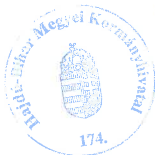
Jambrik Imre állami főépítész