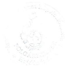
Szólláth Tibor polgármester