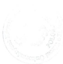
Szólláth Tibor polgármester