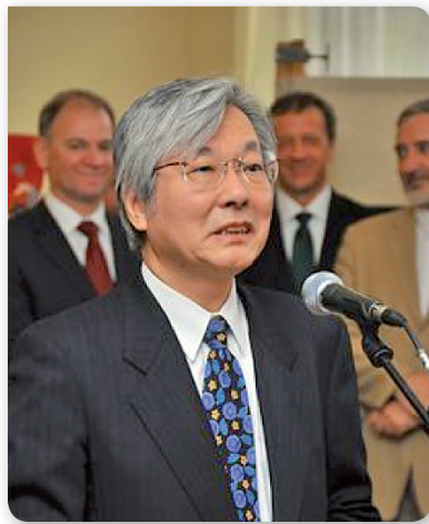
Tadamichi Yamamoto nagykövet úr köszöntőjét tartja

Ezt követően az erősebb ingerek kedvelői is megtalálták a számításukat. Japánban ugyanis óriási hagyománya van a dobolásnak, amelyet, nem csak egyszerű „zenélésnek” tartanak, hanem az önkifejezés, egyfajta mély, spirituális módjának is.