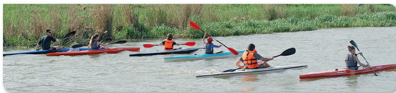
Vízre szálltak kajakosaink