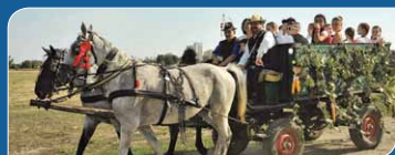
Szüreti sokadalom 2015