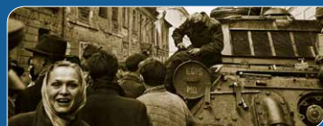
Emlékezés két októberre