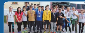
Gimnáziumok harca a sportpályán