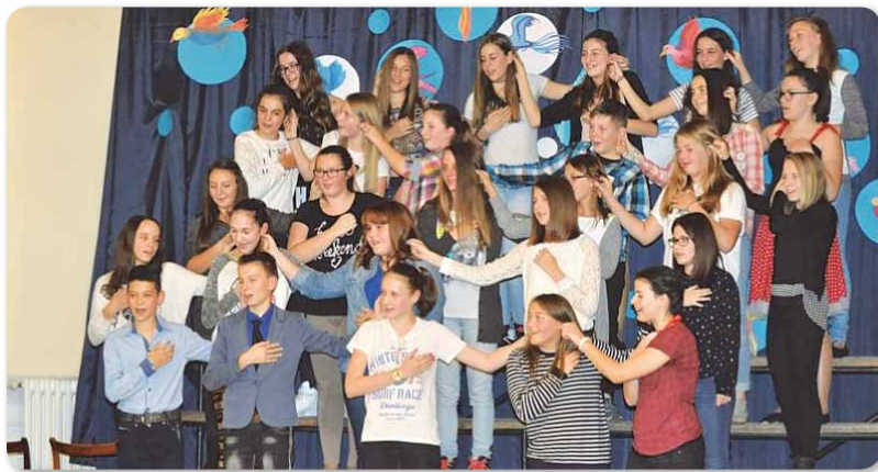
Képek az idei Tücsökavatóról

Az általános tájékoztató során megfigyelhető volt a közelmúltban végzett diákok vallomásait hallani arról, mit adott nekik a Körösi, a jelenlegi képzésben résztvevő