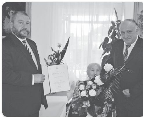
Isten éltesse sokáig Erzsike néni erőben és egészségben családjával körében!"

Tájékoztatom a Tisztelt Lakosságot, hogy Hajdúnánás Városi Önkormányzat Képviselő-testülete 2015. november 30-án (hétfőn) du. 16,30 órai kezdettel a 4085 Hajdúnánás-Tedej, Előháti u. 1. szám alatt található Integrált Községi és Szolgáltató Tér helyiségében városrész tanácskozást tart a hajdúnánás-tedeji lakosság számára.