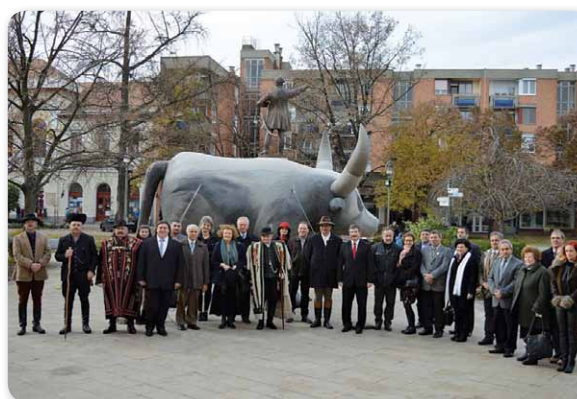
A konferencia résztvevői