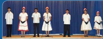
A Szociális Munka Napját ünnepelték november 12-én