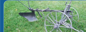
A hónap műtárgya