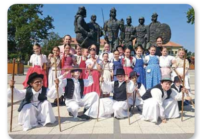
Az ifjú táncosok a táncoló hajdú ösök szobra előtt Böszörményben

Csoportvezetőjük jókedve, energiája, néptáncszerelete megmutatkozott szereplésükön; úgy robbantak be a színpadra, mint a dinamit. Mosolyogva, jókedvűen, ener-