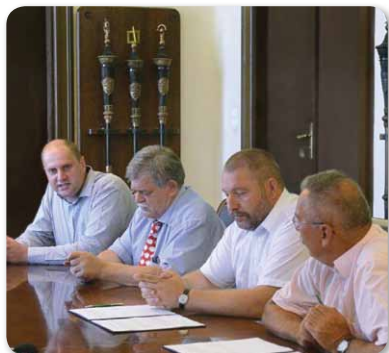
Stratégiai megállapodás a Debreceni Egyetem és Hajdúnánás között