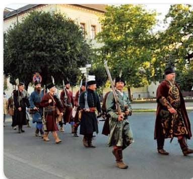
II. Hajdúk Világtalálkozója – 21. századi hajdúk a Bocskai utcán