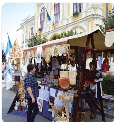
I. Megyei Közfoglalkoztatási Kiállítás Hajdúnánáson