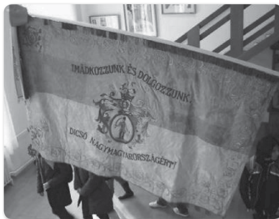
A Dalárda zászlaja a 150. évforduló kiállításán 2010-ben.