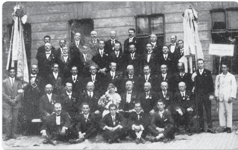
Zászlóavatás az elemi iskola udvarán, 1901.

mokból, főiskoláról küldtek szakavatott és elhivatott ének-zene művelőket. Ezúttal a két fellegvár – Debrecen és Nyíregyháza – meghatározó szerepvállalására utalnék. Személyes példák és életművek, életre szóló tanítások jutottak el vidékünkre a két megyeszékhelyen felkészített tanárok, kórusvezetők révén.