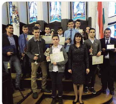
Jó tanuló, jó sportoló diákok kitüntetése a Megyebázán