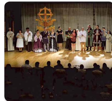
Csillag vagy liliom. A NaNa Színház jubileumi ősbemutatója