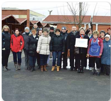
Európai elismerés a Nánási Portéka médiakampányának – KAP Díj. 2. helyezés