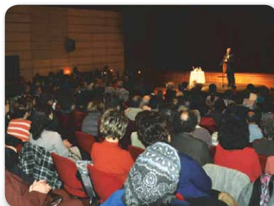
A Magyar Kultúra Napján vendégünk volt Koncz Gábor Kossuth- és Jászai Mari díjas színművész