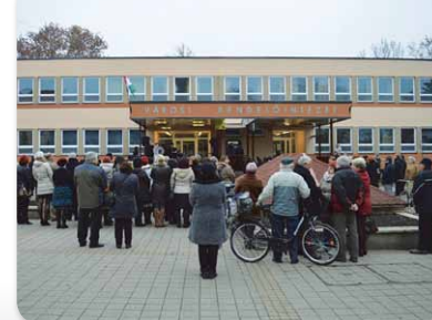
Megújult a Városi Rendelőintézet