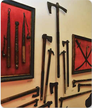
16 századi fegyverek – hajdú őseink hasonlókkal hadakoztak

Hagyomány már, hogy a Város Nap körüli időben a Helytörténeti Gyűjteményben új kiállítással várják a városlakókat és az ide látogató vendégeket. Az idei nagyszabású tárlat ismét Petru Costin ezredes nevéhez kötődik, hiszen a Moldovai Vámszolgálati Múzeum, illetve saját gyűjteményéből évezredek átívelő fegyvergyűjteményt és főként a hadi élethez kapcsolódó anyagot hozott el. A „Hideg fegyverek, munkaeszközök és lőszerszámok” című kiállítás látványos megnyitójára december 12-én délután került sor.