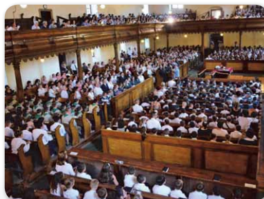
Tanévnyitó istentisztelet a Körösi Csoma Sándor Református Gimnáziumban