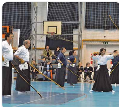
Hajdúnánáson rendezték meg a 7. Nemzetközi Heki Tai-kai Kyudo Világkupa első magyarországi rendezvényét