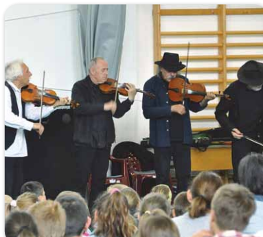
A Muzsikás Együttes a Bocskai Iskola Polgári úti intézményegységében járt