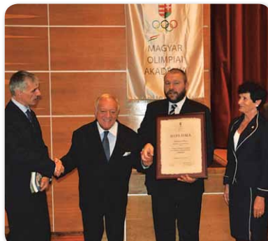
Hajdúnánáson tartotta 65. Vándorgyűlését a Magyar Olimpiai Akadémia