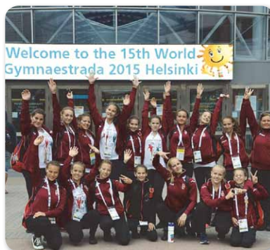
A 15. Gimnasztráda Világtalálkozón jártak a hajdúnánási gimnasztrádás lányok