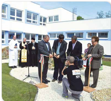
Felavatták a Bocskai Iskola felújított Magyar utcai intézményegységét