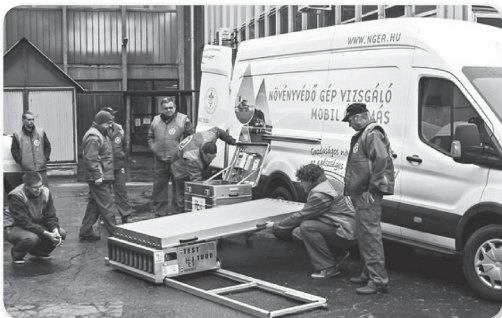
A kontrolláló rendszer egyik nagy előnye a mobilitás

Felülvizsgálják a több mint hároméves permetezőgépek műszaki állapotát. Az országban hamarosan huszonnégy mobil alállomás működik majd, és akár a gazda telephelyén is elvégezhetik a vizsgálatot. A gazdáknak december 14-ig meg kell rendelniük az ellenőrzést.