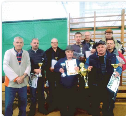
A győztes csapat

bogóra. Akkurátusan válogattuk ki a 30 aspiráns madarat s jókedvűen utaztunk haza „sorsukra” hagyva őket. Pénteken már kaptunk egy telefont, hogy nagy esélyünk van az első háromba kerülni, s vasárnap mikor visszamentünk a kedvenceinkért, a katalógust lapozva (ilyenkor kiadnak a versenyről egy hivatalos eredménykatalógust) meglepődve tapasztaltuk, hogy elsőkké lettünk. Aminek még jobban örültünk, hogy 20 ponttal előztük meg a második helyezet Nyíregyházát s 22 ponttal a bronzérmeseket. Azt tudni kell, hogy száz pont a maximálisan adható egy galambra, de ahogy mondtani szoktuk ilyen nincs. Ettől függetlenül nekünk egy kisállatunk sem teljesít