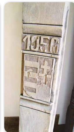
...és ilyen lett

korabeli sajtó alapján a képviselő-testület határozatából: „Felháborodással értesültünk arról, hogy az 1992. december 17-én átadásra váró – az 1956-os forradalom és szabad-