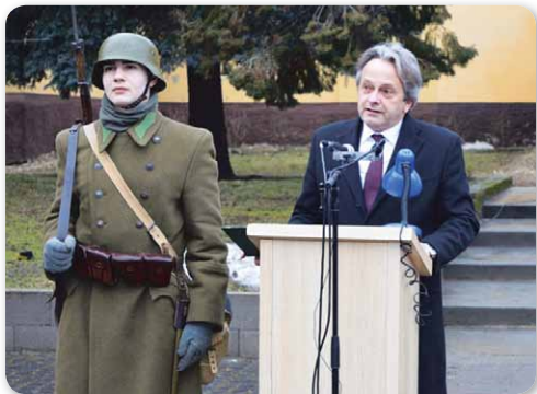
Vargha Tamás honvédelmi miniszterhelyettes ünnepi beszédét mondja

Ezt a tiszteletet immáron 16. alkalommal szervezte meg a Magyar Tartalékosok Szövetsége a Magyar Honvédséggel karöltve, így emlékezve arra a több mint százezer magyar hősré, akik 73 évvel ezelőtt, 1943 telén a Doni katasztrófában, majd a végtelen orosz hómezőkön, vagy