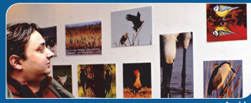
A Hajdúság madarai