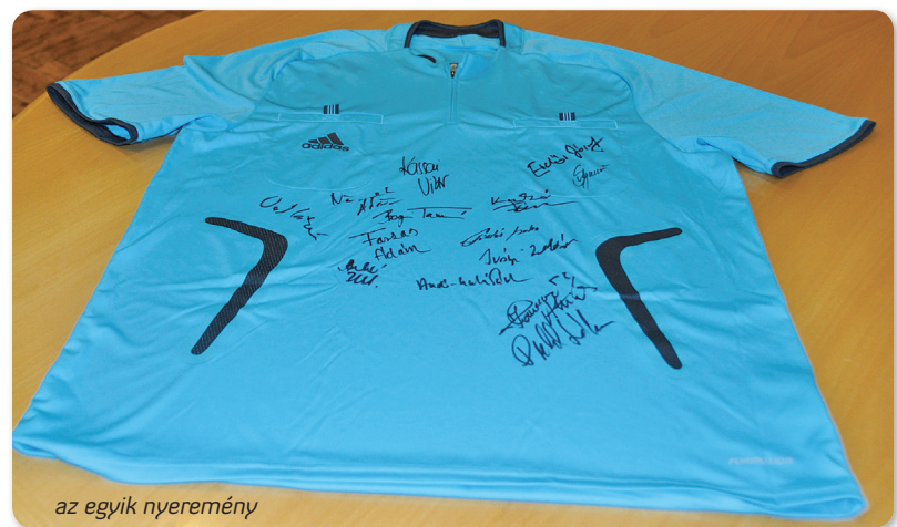
az egyik nyeremény