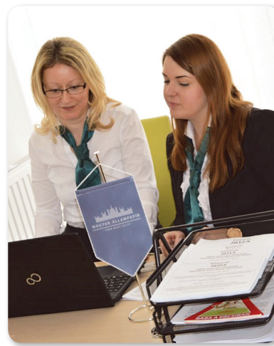
Az ügyfélszolgálat munkatársai

Az állampapírokba történő befektetésnek sok előnye van – hangsúlyozta Balatoni Ildikó: biztonságos, visszafizetése államilag garantált, előre kiszámítható magas hozam, rugalmasság, alacsony költségek, nincs számlavezetési költség.