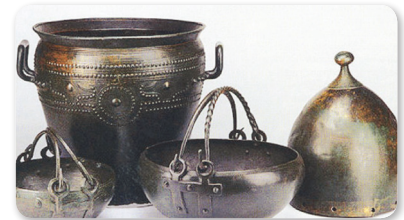
A „böszörményi kincs” néhány darabja