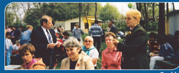
Aranykor és felszámolás...