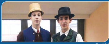
Hajdúnánás néptáncos büszkeségei