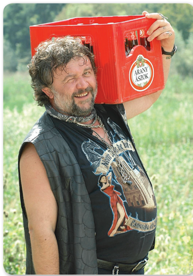
Szoki az Üvegtrigris 2-ből

Az est második részében Varga Márta, a díj egyik eredeti ötletgazdája vezette a kitüntetéssel, valamint Réz András filmesztétával és Szolnoki András film-dramaturggal közös beszélgetést, melyen számos érdekes és vidám történet, anekdota mellett elhangzott, hogy Csuja Imre és Páger Antal számos közös jellemvonása az eszköztelen színjátszás. De közös bennük az is, hogy mindketten szerény körülmények közül indultak. Csuja Imre színészi válásához az adta az első lökést, hogy nagymamája kultúrákedvelő parasztasszony volt, és egyéb szórakozás híján verseket tanított neki óvodás korában – ezeket aztán az estéknenti „tanyázások”, azaz közös szomszédai összejövetelek alkalmával elő is adta.