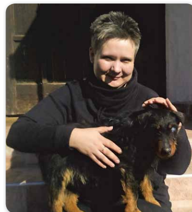
Frici új gazdijával