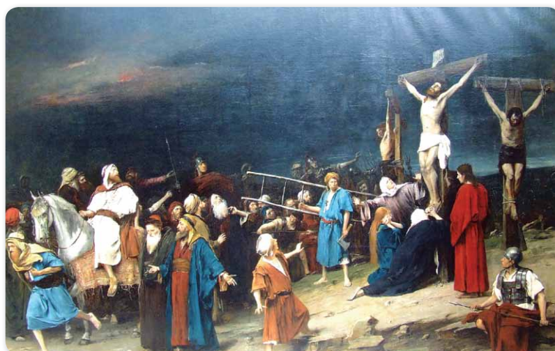
A Golgota, amit a Bibliát latinra fordítók Kálváriára változtatták át.

A szertartások, a szenvedés, a csend megélése után a felhőtlen ünneplés kö-