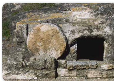
A Szent sír Jeruzsálemben, ahol Jézus feltámadt

Nagypéntek, Jézus keresztalálának napja – gyászünnep. E napon az emberek a település szélén lévő kálváriára – dombok-