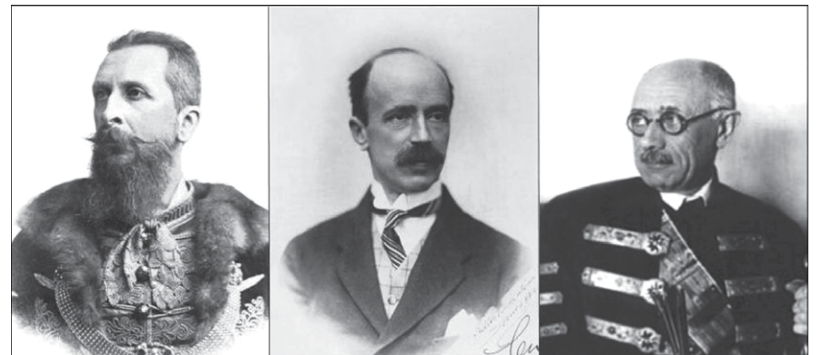
gróf Apponyi Albert

„Ily nehéz és különös helyzet előtt állva, kérdezzük, hogy a fent említett elvek és érdekek mely szempontja váltotta ki ezt a különös szigorúságot Magyarországgal szemben? Talán az ítékezés ténye lenne ez Magyarországgal szemben? Önök, Uraim, akiket a győzelem a bírói székhöz juttatott, Önök kimondották egykori ellenségeiknek, a Központi Hatalmakkak bűnösségét és elhatározták, hogy a háború következményeit a felelősökre hárítják. Legyen így; de akkor, azt hiszem, hogy a fokozat megállapításánál a bűnösség fokával arányban kellene eljárni, és mivel Magyarországot sújtják a legszigorúbb és létét leginkább veszélyeztető feltételekkel, úgy azt lehetne hinni, hogy