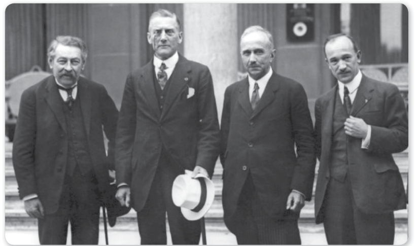
Aristide Briand francia, Austen Chamberlain brit, Vittorio Scialoja olasz és Eduard Beneš csehszlovák külügyminiszter

tak létre a már aláírt Saint Germain-i békeszerződés alapján; – 3 965 km 2 , a Magyar Királyság 1,22%-a.