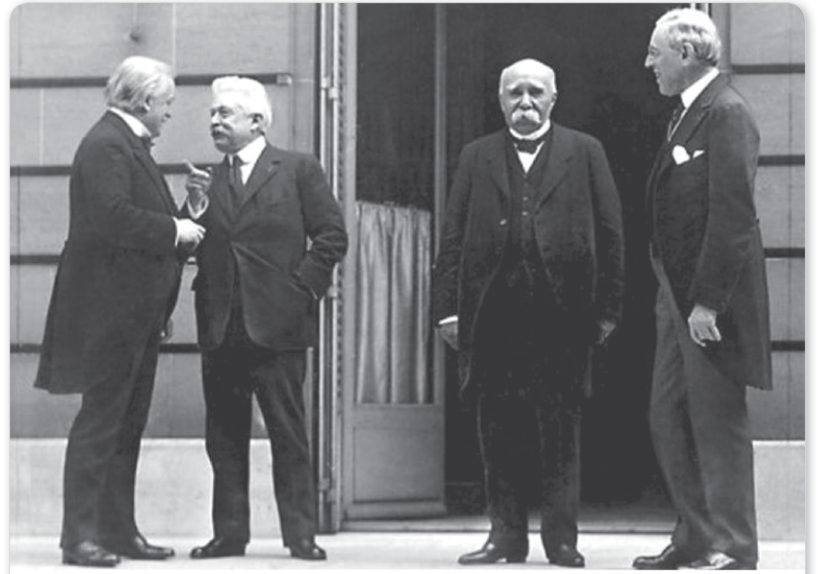
David Lloyd George, Vittorio E. Orlando, Georges Clemenceau, Woodrow Wilson

a Szerb–Horvát–Szlovén Királyság része lett,