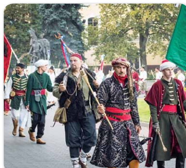
3. Hajdúk Világtalálkozója