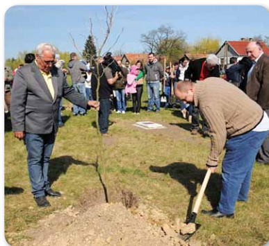
Gyökerek: faültetés az újszülöttek tiszteletére