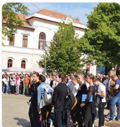
45. Hajdú-Bihar Megyei Elsősegélynyújtó Verseny