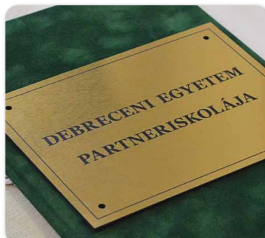
A Debreceni Egyetem partneriskolája lett a Kövösi Református Gimnázium