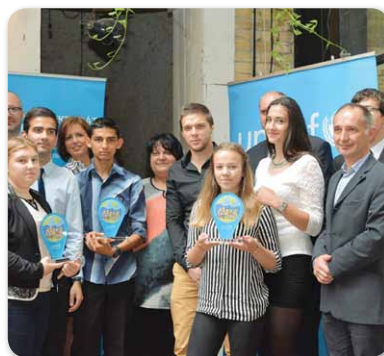
UNICEF Gyerekbarát Település címet kapott Hajdúnánás