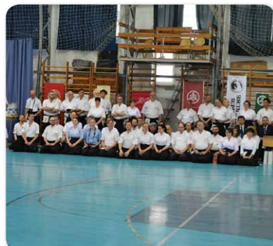
3. Nemzetközi Heki Taikai íjász verseny Hajdúnánáson