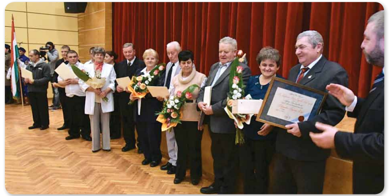
Hajdúnánási Polgárőr Egyesület Tedeji Csoportja