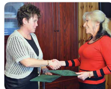
Együttműködési megállapodás a Debreceni Egyetem és a B. Sz. C. Csiha Győző Szakgimnáziuma és Szakközépiskolája között