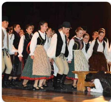
48. Hajdú-Bihar Megyei Gyermek- és Ifjúsági Néptáncfórum