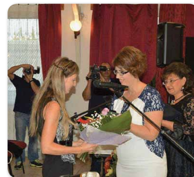
Húsz éves a Fehér Bot Alapítvány