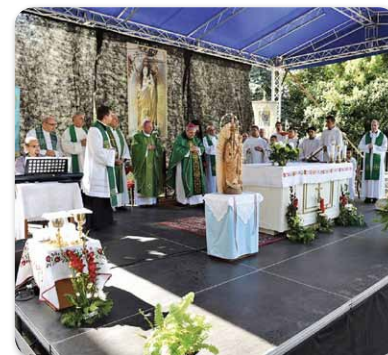
6. Székely Menekültek Emléknapja