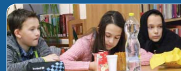
Kik is vagyunk?