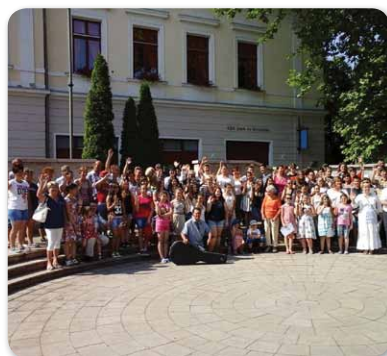
Ötödik Barátságnap a Bocskai Iskola szórvány programjának keretében