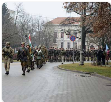
Első alkalommal fogadta Hajdúnánás a Doni Hősök Emléktúrá résztvevőit január végén