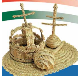
Városi kitüntető díjasok 2016.