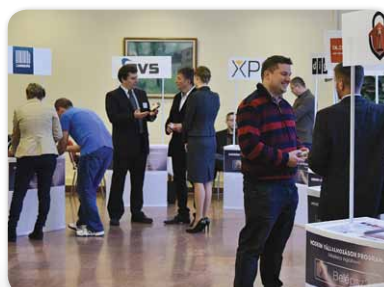
Modern Vállalkozások Napja: Vállalkozz digitálisan!