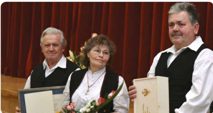
Hajdú Bokréta Hagyományörző Csoport