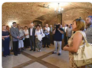
Hazaváró ünnep 2016.