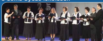
25 éves jubileumi ünnepség a Csiha Győző iskolában