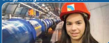
„Felfedezem a világ csodáit” – avagy látogatás a CERN-ben