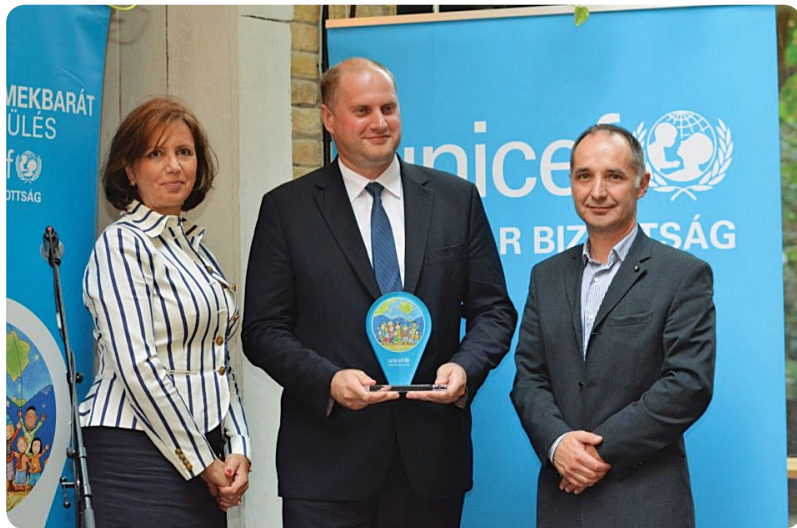
Gyermekbarát Település díjátadó

nu, birkózó szakosztály működik, ebben az évben harmadik alkalommal került megrendezésre a Megyei Röplabda Szövetség által szervezett Nemzetközi Eötvös Strandröplabda Torna, illetve hazánkban először Hajdúnánáson rendezték meg a Nemzetközi Heki Taikai Íjász Világversenyt három alkalommal is, mely jól-