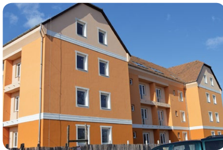
Bocskai u. 79. Fecskeház

Nagy hangsúlyt fektet a település az egészséges életmód, a sport területére is. Magas színvonalú kézilabda, kajak-ke-