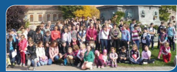
Aradon át Világosig