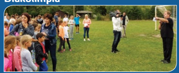
Körzeti mezei futóverseny Diákolimpia