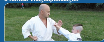
Nánási győztes a Karate Világ bajnokságon