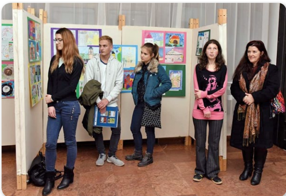
Vers- és novellairó pályázat eredményhirdetése

A városnapi program zárásaként ismét gazdagon terített asztallal várták a vendégeket a helyi vállalkozók a Város Asztalánál. HNU