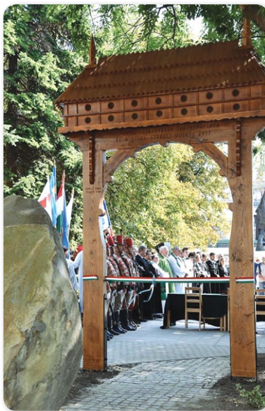
a két város kapcsolatát szimbolizáló székelykapu

gulásunkat szolgálják. Hiszem, hogy Hajdúnánáson a 2017-es esztendőben ilyen fejlesztések valósultak meg, így hát valóban van okunk az ünneplésre.