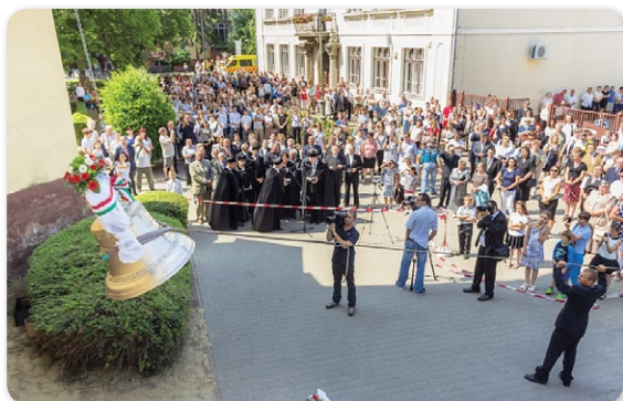
2017. Pünkösöd – helyére költözik az új harang

Ilyenkor év végén nyugodtan feltehetjük a kérdést, hogy van-e okunk ünnepelni, hiszen az esztendőnek ez az a pontja, amikor valamilyen módon mindannyian számot adunk az elmúlt 365 napról, hálát adunk az elért eredményeinkért és átgondoljuk, hogy mennyire sikerült terveinket megvalósítani.