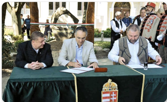
Szent István napja – augusztus 20 – testvérvárosi kapcsolat aláírása a székegyföldi Csíkszereda megyei jogú várossal

A Reformáció 500. évfordulója kapcsán sok-sok kincs és áldást szállt településünkre. 2017 júniusától minden nap új harang kondul meg a református templom tornyában. Idén ősszel átadásra került – az Ercesey család adományaként – az országos szinten is egyedülálló kazettás mennyezetünk, mely a gimnáziumunk