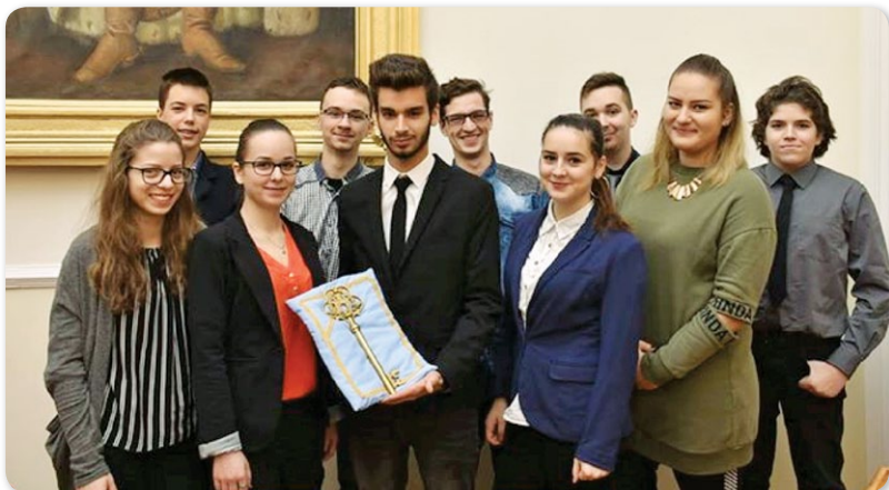
A 2017-ben alakult Gyermek és Ifjúsági Önkormányzat képviselői

Kívánom, hogy idén Karácsonykor minden hajdúnánási otthonba költözzön béke és szeretet! Kívánom, hogy a saját egyéni értékelése során minden helyi lakos találja meg 2017-es esztendő azon pontjait, amik ünneplésre adtak okot és