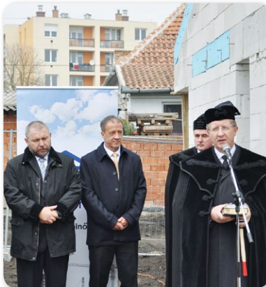
Reformáció Hete – a Körösi Gimnázium új tornatermének ünnepélyes alapkövetétele