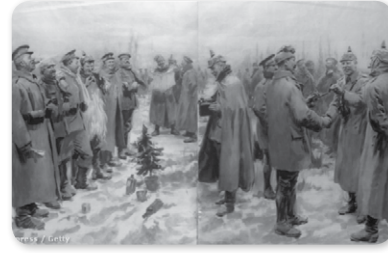
Német és brit katonák közösen karácsonyoznak 1914-ben.

1914 karácsonya az átlagnál is hidegebb volt, és bár a levelek már rég lehullottak, a katonák mégsem tértek haza, hanem egy olyan háború első karácsonya elé néztek, amihez fogható addig nem volt a történelemben. De ezen a karácsonyon fordult elő talán utoljára a történelemben, hogy nem hivatalos tűzszünet jött létre a szemben álló felek között.