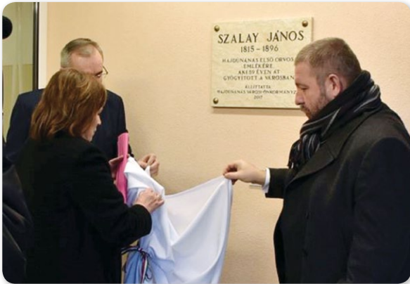
Emléktábla avató a Szalay János Rendelőintézetben

Több mint harminc éve már, hogy Hajdúnánás december 12-én ünnepi programokkal emlékezik és tiszteleg az 1605-ben, Korponán kihirdetett hajdúszabadság születésnapjára. Az idei, 412. évforduló városnapi programsorozata már a kora délutáni órákban kezdetét vette, majd este folytatódott a Bocskai szobor megkoszorúzásával, illetve az ünnepi képviselő-testületi üléssel. A testületi ülésen ezúttal is többen vehettek át Polgármesteri Elismerő Okleveleket, illetve részesültek városi kitüntetett díjazásban.