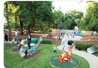
Ady Endre lakópark – játszótér látványterve

azt is kívánom, hogy 2018 bővelkedjen azokban az eseményekben, amelyek a közös ünneplésre teremtenek lehetőséget!