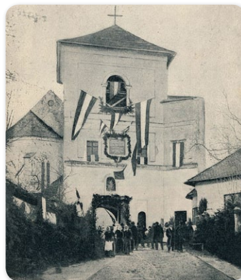
A korponai vártemplom, ahol kihirdették a hajdúszabadságot. A fotó a 300. évfordulón készült

17-én vonult Bocskai fejedelem Korponára huszonkét vármegye, valamint a felső-magyarországi szabad királyi városok s Erdély követeivel, e mellett közel