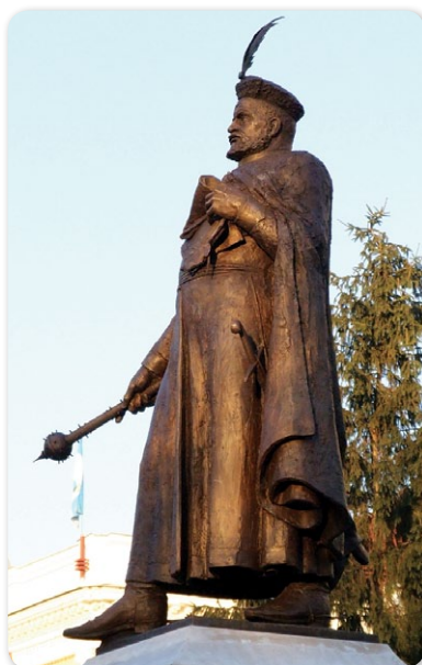
Bocskai fejedelem szobra Hajdúnánás főterén (2005)

A Bocskai István által letelepített hajdúk városaiban évszázadok óta ünnepi esemény december 12-e, ama jeles napnak emléke, amikor 1605-ben e napon hirdették ki Korponán a hajdúk közös nemességét. Passuth László Sárkányfog c. regényéből idézve emlékezünk a 412. évvel ezelőtt történetekre, azokra a pillanatokra, amelyek a hajdúk és Bocskai kapcsolatában meghatározóak voltak.