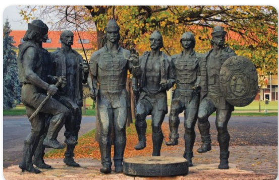
Kiss István alkotása, a Táncoló hajdúk Hajdúböszörmény főterén. A hét lakos kompozíció a hét hajdúvárost, Nánást, Szoboszlót, Dorogot, Böszörményt, Vámospércset, Polgárt, Hadházt szimbolizálja. Az előtérben elhelyezkedő abroncsba zárt malomkő a Hajdúkerület egységét jelképezi.

Az mindenesetre történelmi tény, hogy Korpona 1605 novemberében országgyűlés színhelye volt. 1605. november