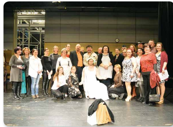
A MASZK színtársulat kiegészülve a Naná Színház néhány tagjával.