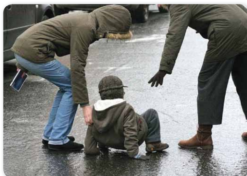
Az ónos eső gyakori következménye

A hosszú fagy után, ha nincs szerencsénk (és sokszor nincs, mert a Kárpát-medence kedvez ennek az időjárásnak) akkor az enyhülés sokszor ónos eső formájában érkezik jégpályává változtatva az utakat az autósok és járókelők „legnagyobb öröme”. Azt viszont kevesen tudják, hogy az ónos eső is magyar találmány... Na persze nem a szó-szoros értelmében, de amíg a világ nagy részén sima tükörfordítást – például az angoloknál Freezing Rain vagy Sleet(dara) – használnak addig nálunk ónos vagy pedig –főleg az idősebbek körében– ólmos eső a neve. Ez a sajátos kifeje-