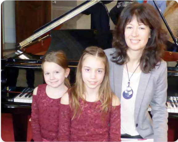
Az „Arany-os” tanítványok és felkészítőjük

A Zeneképzlet Négykezes Zongoraverseny Határok nélkül második alkalommal került megrendezésre Egerben, 2017. március 2–5. között az Eszterházy Károly Egyetemen.