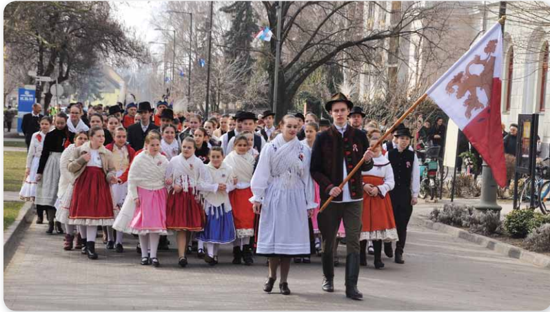
Bocsikai István zászlaja vezetésével

2017. március 15-én ünneplőbe öltözött emberekkel népesedett be városunk főtere. Az 1848–49-es forradalom és szabadságharc 169. évfordulójára emlékeztünk. A magyar történelem egyik leglényegesebb időszakáról szól ez az ünnep, amelynek mostani megünneplésére került sor.