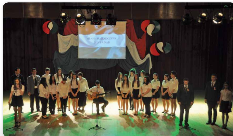
Kőrösi gimnazisták ünnepi műsora