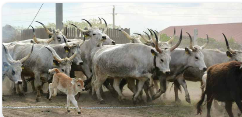
Szürkék kisborjaikkal éppen a láncon baladnak át

Az idei ünnepségnek illusztris külföldi vendége is volt, nevezetesen Kosuge Junichi úr, Japán magyarországi nagykövete.