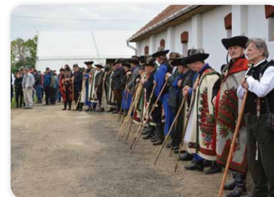
A Hortobágy Örökös Pásztorai

valaha a pásztorember mindennapjainak része volt. A jószágot pányvával fogták ki gulyából, a karikásostor a pásztor meghosszabbított karja volt, ha pedig némi változatosságra vágyott, pásztorbotjával el-elütött egy-egy nyulat, és este már finom nyúlparikás rottyogott a kondérban.