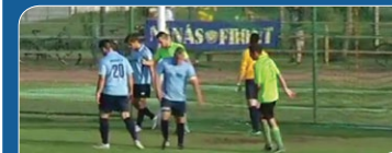
Egyre jobbak vagyunk