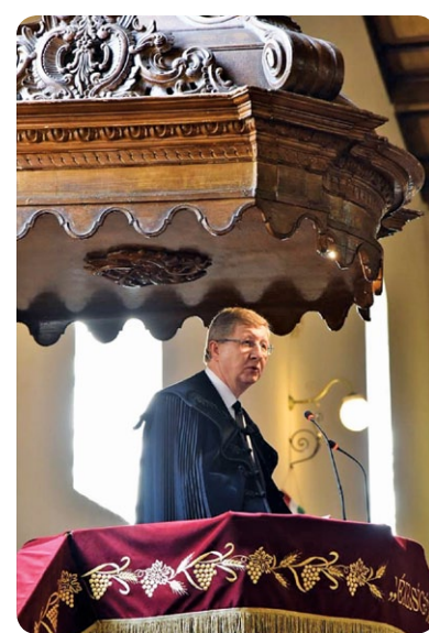
Ígét hirdetett Ft. Dr. Fekete Károly a Tiszántúli Református Egyházkerület püspöke

A köszönet hangján kezdte köszöntőjét Hajdúnánás polgármestere: „Köszönöm az előttünk járó őseinknek, hogy példát