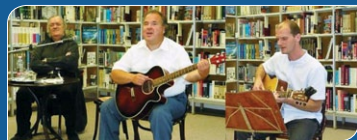
„Zene füleimnek” ...