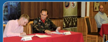
Túl a százon