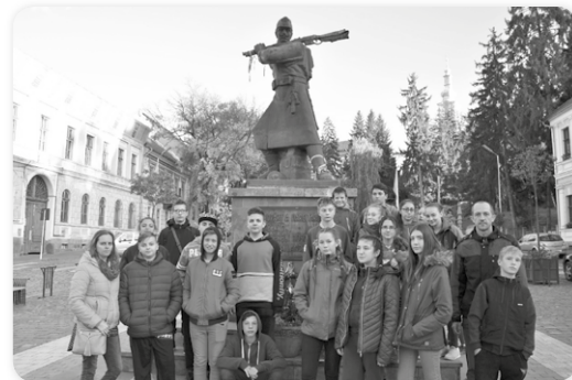
Székellyudvarhely, Vasszékely emlékmű

Iskolánk hetedikes, nyolcadikos diákjai – az Emberi Erőforrások Minisztériuma által kiírt „Határtalanul 2018” pályázat keretén belül – tanulmányi kiránduláson vettek részt szeptember 24–27. között Erdélyben. A pályázat célja az volt, hogy megismerkedjünk Erdély természetföldrajzával, az ott élő magyar emberekkel, magyarul lakta településekkel, történelmükkel, próbáljunk együtt érezni velük, átérezni sokszor nehéz helyzetüket. Csodálatos helyszíneken jártunk a négy nap alatt.