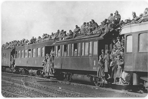
A nyugati frontról hazatérő katonák 1918 novemberében

A két világháború között Nagy Háborúként emlegették a 20. század első nagy esztelenségét, amely katonaruhába öltöztette a férfiak színe javát a világ minden szegletéből. Vilmos császár 1914 nyarán még mindössze egy falevélhullásnyi időt ígért Európa népének, s aztán hazatérnek legényfiúk és édesapák.