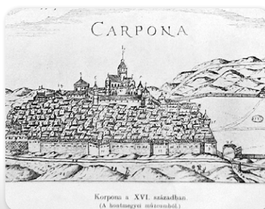
Korpona a XVI. században. (A bentmagyi műszobor.)