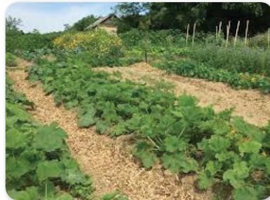
Talajtakarás a kiskertben

A biológiai kertművelésnek egyik sajátos módszere a talajtakarás, amit mulcszásnak vagy felszíni komposztálásnak is szoktak nevezni. A kert talaja ki van szolgáltatva az időjárási viszonyoknak. Télen megfagy a felszíne és károsodik a talaj