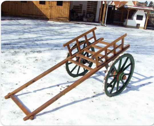
A kézi taliga a múzeum udvarán

A taligán, taligán mindig kétkerekű járművet értünk. Az emberiség legrégebbi járműve ez az állati vagy kézi erővel vont eszköz, melynek neve használatának módjából, a tol, toliga szóból ered. Bibliái idők teherhordó járművéről van tehát szó, amely Eurázsia déli tájain, Nyugat Európában és a Földközi tenger vidékén is használatos. Indiában, Kínában ma is gyakori látvány az utakon, teher- és személyszállításra egyaránt használják. Egyébként lehet egy-vagy két rúdú. Közös jellemzőjük az egyszerű szerkezet, melynek számtalan variációja ismert, annak függvényében, milyen célra készítették. A tengelyre szerelt felépítmény a szállítandó teher jellegének felelt meg.