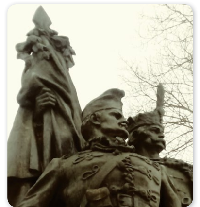
A hős katonára szobra az állára tapadt hógolyóval

Vajon ezek a gyerekek ismerik ezt a történetet? Most, a Nagy Háború centenáriumi idején hallottak arról a véráldozatról, melyet elődeik életük fel-