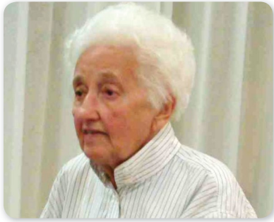
Hajdúnánás, 1927.–Budapest, 2018.

Hát Ő is elment! Ő, akiről azt gondoltuk, örökké itt lesz közöttünk, törekeny természetével, szelíd, megértő, okos lényével. Leszáll a vonatról, jön végig a Bocskai utcán, elmaradhatatlan kis hátizsákjával, amiben mindig volt valami meglepetés, ajándék, emléktöredék a régmúltból.