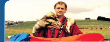
Ismét Hajdúnánáson a Hódítók Kupája