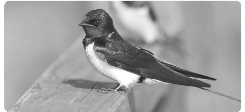
Füstifecske és fiókái

A Nyugat-nílusi láz és a szarvasmarhák veszélyeztető kényelv-betegség már jelen van Magyarországon, mint ahogy a kutyák körében szúnyogcsípéssel terjedő szívférgesség is. Az embereket megbetegítő, afrikai eredetű Chikungunya-lázat terjesztő ázsiai tigrisszúnyogot pedig már több európai országban is kimutatták, Európa mediterrán térségeiben egyre gy-