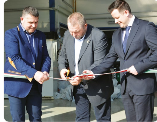
Autószerelő műhely ünnepélyes átadása

Ipari terület kialakítása, felére csökkent közfoglalkoztatás, megújult középületek, fecskelakások a fiataloknak – csak néhány példa arra, hogy folyamatosan nő Hajdúnánás regionális jelentősége és gazdasági teljesítménye.