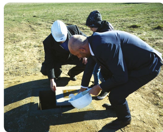
Hűtőház ünnepélyes alapkövetétele

A fecskelakásokkal, a fecskeotthonokkal, a gyermekegészségügyi centrum létrehozásával, a fél millió forintos lakásvásárlási támogatással a fiataljainkat akar-