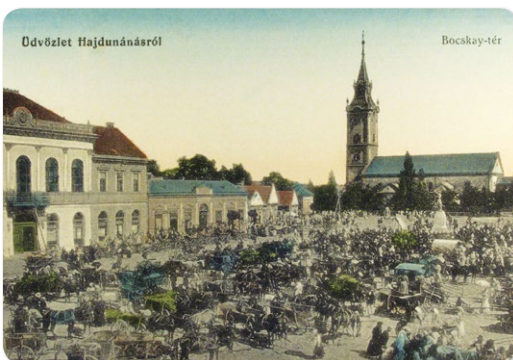
Piacozók, vásárolók a mai Köztársaság téren 1910-ben

A közel kétszáz méter hosszú alkotás, leszámítva az északnyugati szegletet, amely