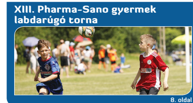
XIII. Pharma-Sano gyermek labdarúgó torna