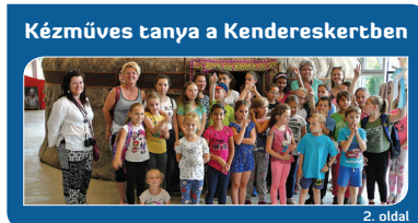
Kézműves tanya a Kendereskertben