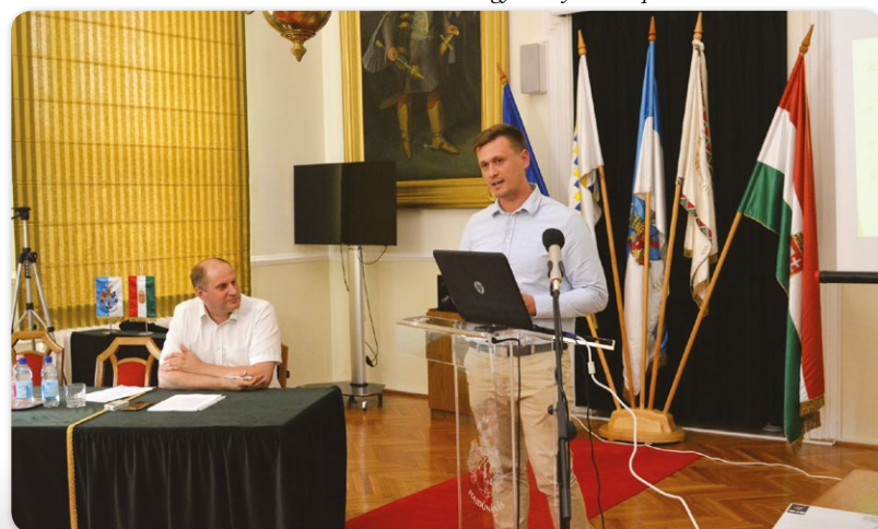
„A hajdúk és a város története” tudományos konferencia

Keresse a NÁNÁSI KISOKOST a Hajdúnánási Újságban!