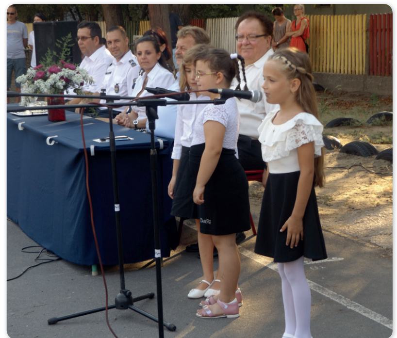
Elsősök versmondása a tanévnyitón

A KRÉTA rendszerben már részben tavalys is lehetett használni az elektronikus ügyintézés, erre az idén is lehetőség lesz.