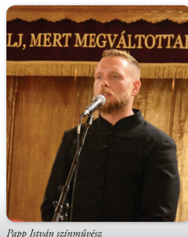
Papp István színművész