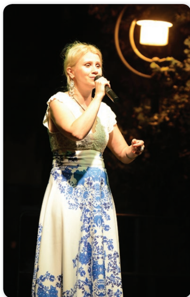
Kovács Nóri: Nimród regéje

Augusztus 20-a az egyik legrégebbi ünnepnap Magyarországon. Az utolsó magyar fejedelem és az első keresztény király, Szent István napja, és egyben az államalapítást, valamint a magyar államiság folytonosságát is szimbolizálja.