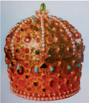
A 410 éve Bécsben őrzött Bocskai-korona

Ebben az írásban egyetlen győztes szabadságharcunk jelképéről, Bocskai István koronájáról emlékezünk meg. A török szultán ugyanis ezzel ismerte el a „magyarok Mózesét” Magyarország királyaként, melyet szabadságküzdelmeinek méltánylásául ajándékként küldött neki. Átadása 1605. november 11-én a Pest melletti Rákos mezőn történt, ünnepélyes ceremónia közepette, amikor Lala Mehmed pasa Bocskai fejére helyezte a színarany fejéket.