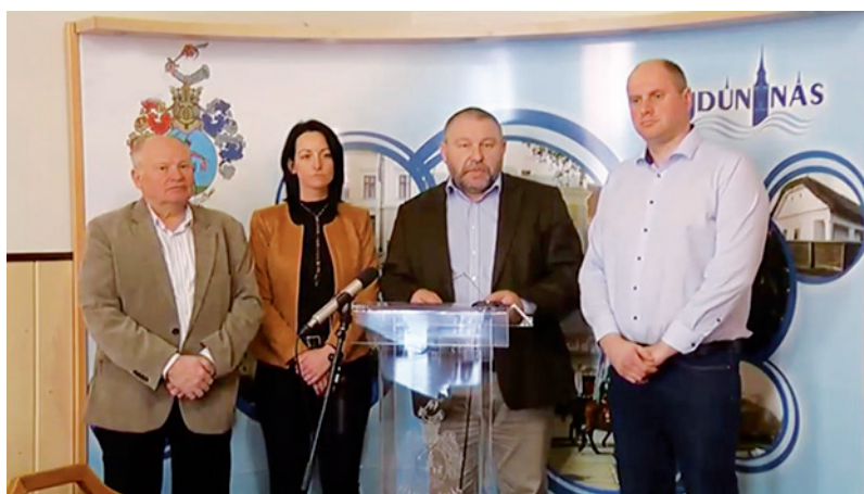
Sajtótájékoztató 2020. március 20-án a koronavírus-járvány megelőzés érdekében tett helyi intézkedésekről

Az elmúlt hetek híradásait figyelve a város életét leginkább befolyásoló kérdéskörökben a hétköznapi ember csak kapkodja a fejét. Szinte minden napra jut egy-egy tájékoztató arról, hogy a koronavírus járvány megelőzése érdekében milyen gyakorlati intézkedések születtek. Másrészt március hónapban nem volt képviselő - testületi ülés, polgármesteri hatáskörben születtek döntések, így például a televízió élő testületi ülésének közvetítéséhez szokott lakosoknak ezt az információs forrást nélkülözniük kellett. Ezért az elmúlt időszak intézkedéseiről, azok háttereiről kérdeztük Szólláth Tibor polgármestert.