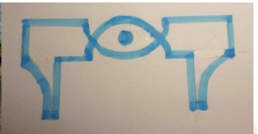
Balra: a templom tornyának keleti oldalán megőrződött Isten szeme ábrázolás. Mellette a rekonstrukciós rajza.