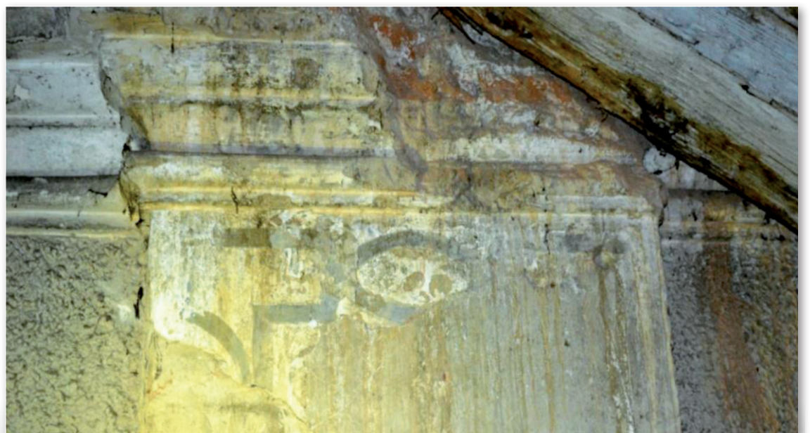
A felújított toronysisak a rajta látható jelképekkel és az 1810 előtti toronyrészlet a festett díszítőmotívummal.