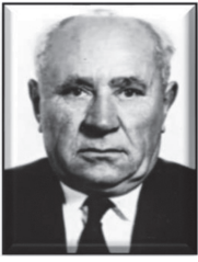
H a j d ú n á s , 1927.01.12 – Hajdúnánás, 2020.03.25

Kevesbednek soraink, mennek el egymásután a régi kedves ismerősök, akik úgy hozzátartoztak életünkhez, mint megszokott, kedves bútoraink, akikről el sem tudtuk képzelni, hogy egyszer csak kézbe veszik a vándorbotot és elindulnak a mindenélők útján, oda abba a távoli világba, ahová egyszer minden halandó eljut.