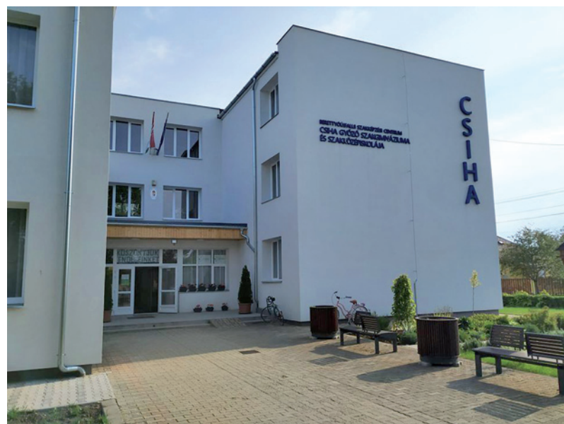
Berettyóújfalusi Szakképzési Centrum Csiha Győző Szakgimnáziuma és Szakközépiskolája

2020. május 4-én hétfőn a magyar nyelv és irodalom, valamint a magyar, mint idegen nyelv tárgyak írásbeli vizsgáival megkezdődött a 2019/2020-as tanév május-júniusi érettségi időszaka. A koronavírus – járvány miatt különleges körülmények között kezdődtek meg a vizsgák, az érettségi szabályaiban olyan speciális változtatásokra volt szükség, amelyek elsődlegesen az egészségvédelmet szolgálták.