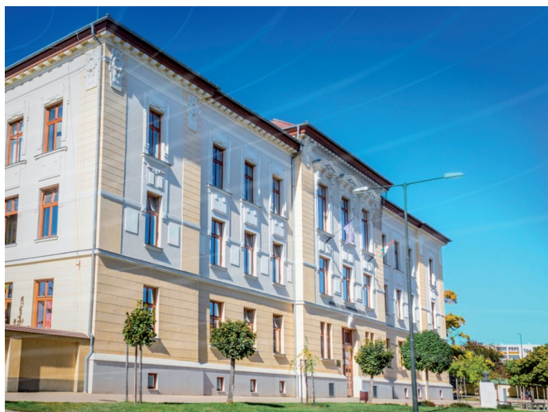
Körösi Csoma Sándor Református Gimnázium