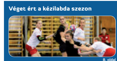
Véget ért a kézilabda szezon