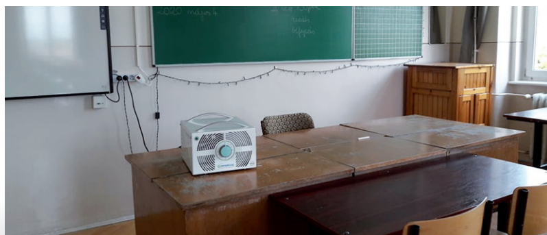
Özongenerátor a tanterem fertőtlenítéséhez

A Kormányrendelet, mely tartalmazza a veszélyhelyzet során az érettségi vizsgák 2020. május-júniusi vizsgaidőszakban történő megszervezéséről szóló szabályzatokat rendelkezik a vizsgadolgozatok javításáról és a dolgozatok megtekintéséről is. Így a dolgozatok megtekintését két napra biztosítja (2020. május 28-29.) és pünkösd után június 2. kedd 16.00 óráig lehet észrevételt tenni a vizsgadolgozatok értékelésével kapcsolatban. Itt került meghatározásra a vizsgaeredmények megállapításának és adminisztrálásának időszaka is, mely alapján a sikeres érettségizők legkésőbb június 16-án már érettségi bizonyítványt tarthatnak a kezükben. HNU