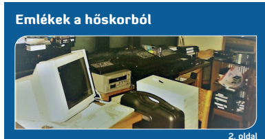
Emlékek a hőskorból