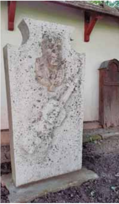
Rézsműves Tódor sírköve a múzeum udvarán felállítva

Ma már alig vannak olyanok, akik emlékeznek még a nagyhírű muzsikusra, akinek a neve fogalom volt nem csupán itthon, hanem a határokon túl is.