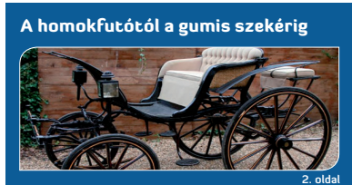
A homokfutótól a gumis szekérig