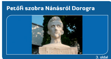
Petőfi szobra Nánásról Dorogra