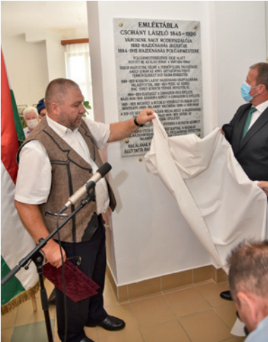
Csohány László emléktábla avatása

Hajdúnánás idén már 12. alkalommal hívta és várta haza a távolba szakadt atyánkfiait augusztus 20-án. Az eddig két napos baráti találkozó az ismert járványügyi szabályok miatt ezúttal csak egy napra, augusztus 20-ra korlátozódott.