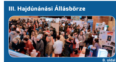
III. Hajdúnánási Állásbörze