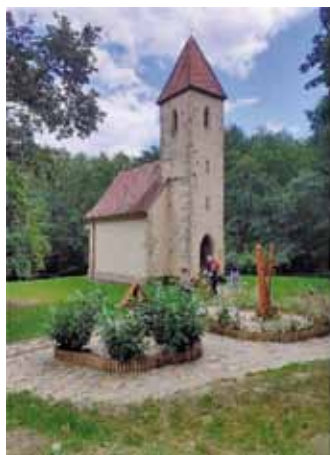
A veleméri árpád-kori Szentbármóság templom