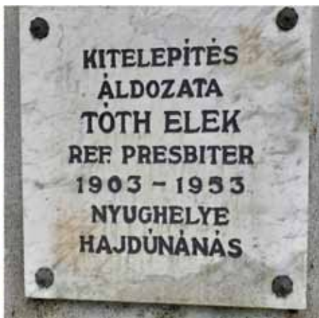
A veleméri kegyeleti emlékmű márványtáblája

A borongós júliusi nyárban családommal ismét a varázslatos Őrségben járhattunk. Most is felkerestük a szerez települések „országának” egy picinyke szerét, az Árpád-kori templomáról híres tenyérnyi falucskát, a Vas megye délkeleti csücskében meghúzódó Velemért, melyet szívet tépő emlékek fűznek Hajdúnánáshoz.