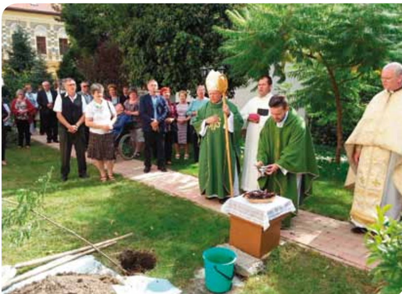
A nemzeti összetartozás fájának megszentelése