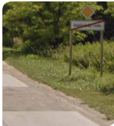
Főút az, amit táblával jelölnek, a minőség nem számít