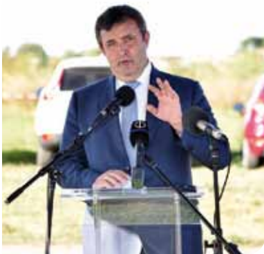
Palkovics László Innovációs és Technológiai Miniszter

Városunk az elmúlt időszakban igyekezett felkészülni a befektetők fogadására és ezáltal hozzájárulni a teljes hazai befektetési környezet versenyképességének fokozására.