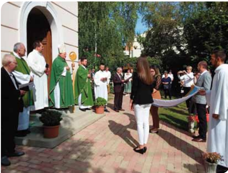
A zászlószentelés pillanata a templom előtt