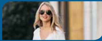
Az anyag- hordjuk vagy viseljük