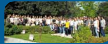
Óvodai dolgozók kirándulása