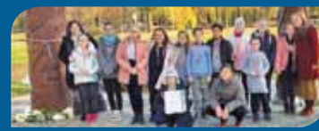
Vándorlegények és leányok