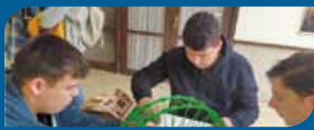
Csihás hídépítők sikere