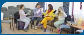
Bábszakkör a művelődési központban