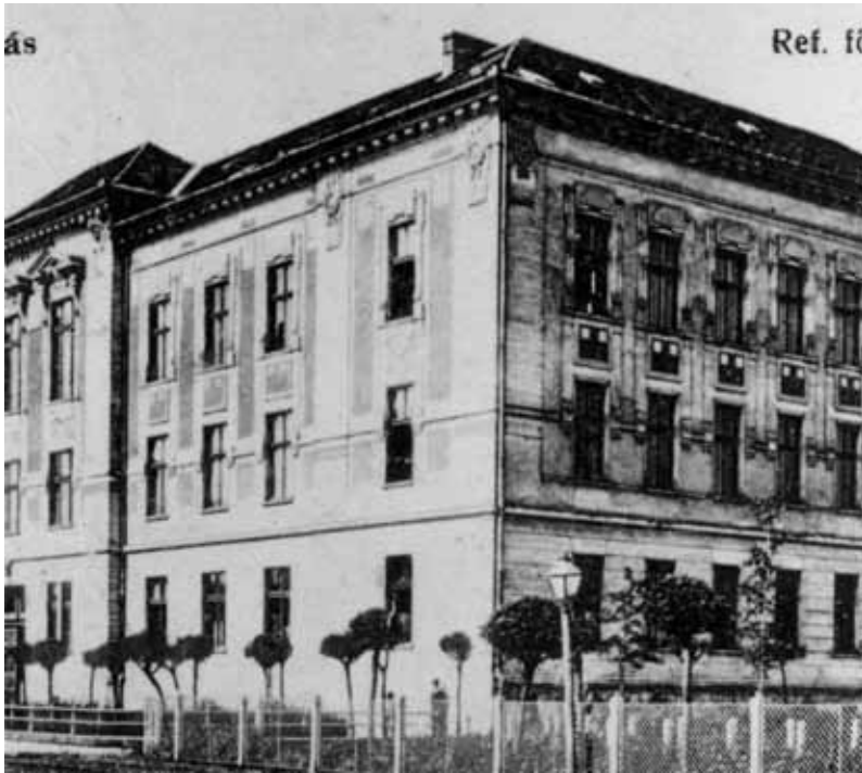
Petróleumlámpa a 20. sz. elején a gimnázium mellett

Ma már el sem tudjuk képzelni az életünket villamosenergia nélkül, hiánya szinte megbéníthatja mindennapjainkat. Pedig kedves olvasók városunkban mindössze 95 éve létesítettek villanytelepet, kapott a város villamos világítást. 1926-ban egy szeptemberi vasárnap este