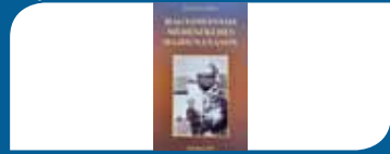
Hagyományos méhészkedés Hajdúnánáson