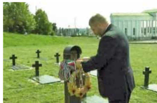
A második látogatás 2019 nyarán

November 3-a Hajdúnánás életében tragikus eseményeket idéző dátum. A második világháború a végét járta, a szovjet Vörös Hadsereg előőrszei 1944. október 31-én bevonultak Hajdúnánásra, majd november 3-án és 4-én - a legutóbbi kutatások tükrében - közel 800 férfit, többnyire inkább idősebb embereket, vagy éppen fiatal legénykéket tereltek össze az akkori Szülőotthon udvarára, majd indították útjára a menetet Debrecen felé, akik közül közel háromszázán már soha nem tértek vissza. Nem volt ez példa nélkül való, hiszen azokban a hetekben számtalan ilyen eset történt, így szerzett megfelelő számú „hadifoglyokat” a Vörös Hadsereg.