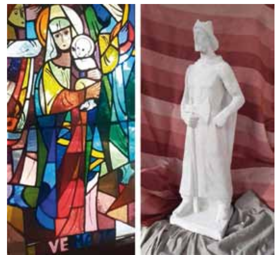
Az Ave Maria című üvegmozaik Szent László király kőszobra

Ez az egykoron templomfalon, homlokzati fülkében álló alkotás, monumentálisabb párjával együtt - amely az Isten Házát körül ölelő Boldogasszony Kertjében áll -, Hajdúnánáson