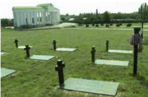
Az egykori 104.sz. hadifogoly tábor helyén létesített pantheon, ahol a nánási elhunytak emlékét hirdeti a kopjafa.