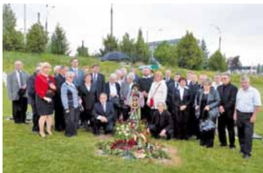
Közel hetven év után az első nánási végtisztességtevők - 2013. június 7.