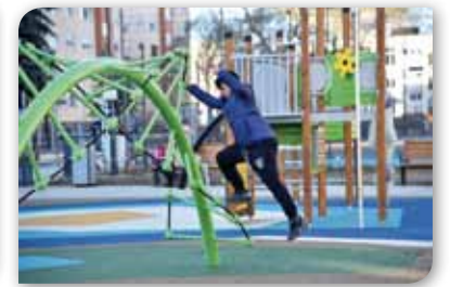
Megnyitott az Ady játszótér

megvásárolt az önkormányzat, és amiért igen sok kritikát kapott. Most arról tudok beszámolni, hogy az épület egy részét értékesítette a város, és egy részén pedig apartmanházat alakítunk ki. A három szintes épületben 93 fő részére 21 apartman kerül kialakításra. A felújíttása során új, háromrétegű nyílászárók kerülnek beépítésre, az épület földemére és homlokzatára hőszigetelő rendszer kerül, a megújuló energiaforrások hasznosítása érdekében napelemes rendszer kerül telepítésre. Az épületben lesz portaszolgálat, csomagtároló, közös használatú „mosókonyha, vasalási lehetőséggel, közös nappali, és orvosi szobával ellátott betegszoba. Az épület fűtését kondenzációs fali kazán fogja biztosítani. Teszem hozzá ez szintén egy olyan beruházás, amely folyamatos, és jelentős bevételt hoz a városnak, önfenntartóvá válhat.