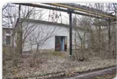
Megújul az egykori Tungsram telephely

Hajdúnánáson az utóbbi években jelentős beruházások, fejlesztések valósultak meg, de igazi nagy áttörés foglalkoztatás, gazdasági erő növelése szempontjából nem volt jelentős mértékű, a város minden erőfeszítése ellenére. Ebben a folyamatban azonban 2020-ban éles fordulat következett be, amely óriási lehetőségeket biztosíthat Hajdúnánás és lakói számára.