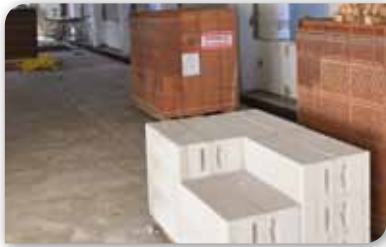
Felújíttás a Mártírok útján

tos szerepet játszanak a Tungstram speciális lámpái, amelyek a napfényével azonos hatású, egyenletes fejlődést, érést tudnak biztosítani a növényeknek. A napokban az önkormányzat közmunka keretében megtisztítja a telepet az elburjázott növényzettől, így is segítve a beruházást.