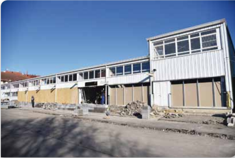
Felújíttás a Mártírok útján

A Mártírok útiúv levő apartmanház felújíttásáról készült felvételeket itt láthatia.