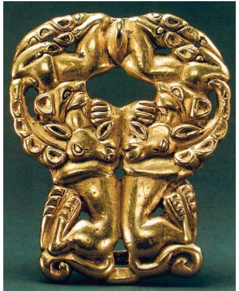
Szkíta kincs - állatküzdelmi jelenet, Xiongnuk arany övcsat.