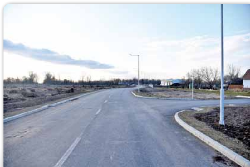
Épül az új Ipari park

A Tungsram telephelyén folyó munkákról és az új Ipari parkról készült riportot itt nézheti meg.