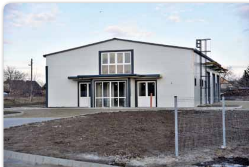
Épül az új Ipari park

- A Debreceni Egyetem és a Tungsram Csoport közös kutatás-fejlesztési programja keretében egy ún. vertikális farmot alakítanak ki, amely komoly tudományos műhelymunkáknak is helyet adhat majd, hiszen a megvalósuló beruházás az egyetem egyfajta kihegyezett tanszékének is tekinthető. Természetesen ebben a folyamatban a város mintegy multiplikátor vesz részt és lehetőségeihez