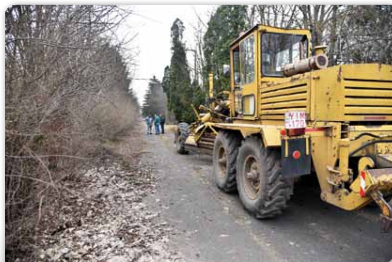
Megújul az egykori Tungsram telephely

mon ugyanis izzószálak húzása helyett a legújabb növénytermesztési technológiával természetesen majd zöldségféléket, elsősorban paradicsomot, gyógyászati célú felhasználásra. A folyamatban igen fon-