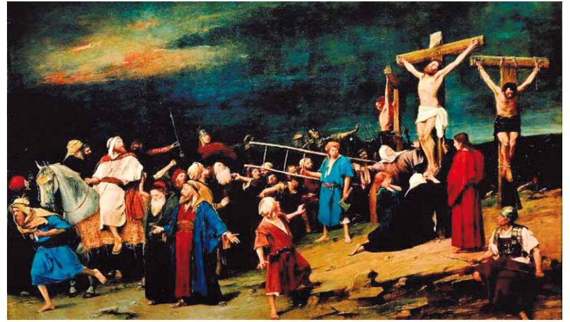
Munkácsy Mihály: Golgota 1884. Déri Múzeum, Debrecen

„ Családon belül is lelkünk előkészítésével foglalkoztunk, apám bezárt zeneszekerényt, zongorát, ki milyen szórakoztató könyvet olvasott, beszolgáltatta, [...] a család szelleme csendet követelt, [...] nem szólhatott a