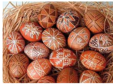
Viaszolt hímes tojások

„ Iszonyú, hogy elporlad a testem, és hogy elszáll a lélek, hogy a halálnak horga ma vagy holnap már könnyen elérhet. Mégsem fürdöm örületben, Mint Hölderlin és annyi társam, Mert oly népből születtem, Mely bizik a feltámadásban. ” (Horváth Imre: Származásom )